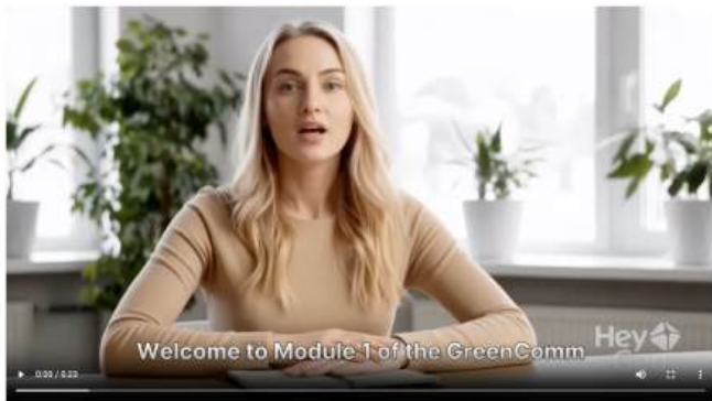
Module 1 – Scientific Data Mining and Ethical Audit Protocols: Introduction and Strategic Rationale